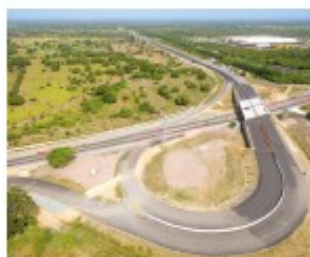
Intersección con la Via Oriental

Por otra parte, el retorno del Viaducto a la altura de La Boquilla, también se encuentra terminado y se realizan algunas obras complementarias.