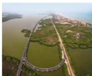
Viaducto sobre La Ciénaga de la Virgen

En esta Unidad Funcional se ejecutan actividades de construcción en la calzada derecha y la continuación de la calzada de servicio con cicloruta entre el K1+200 y el K1+600 sector comprendido entre La Bocana y Cielo Mar y actividades de construcción de la cimentación profunda para el puente vehicular en el sector de las Américas.