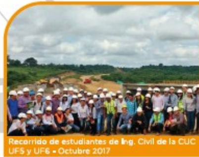
Recorrido de estudiantes de Ing. Civil de la CUC UF5 y UF6 - Octubre 2017