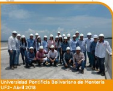
Universidad Pontificia Bolivariana de Montería UF2 - Abril 2018