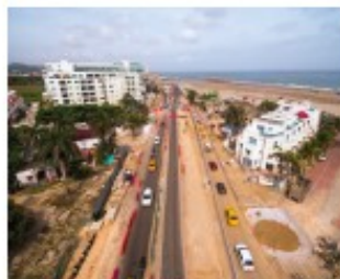
Sector Cielo Mar, Cartagena

Las Unidades Funcionales que conforman el Proyecto 4G Cartagena Barranquilla y Circunvalar de la Prosperidad continúan avanzando a buen ritmo según los cronogramas de la Agencia Nacional de Infraestructura ANI. Las obras que se ejecutan benefician a los departamentos de Bolívar y Atlántico.