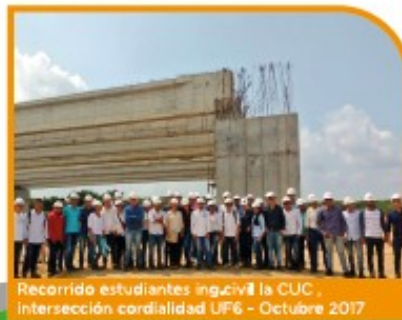
Recorrido estudiantes ing.civil la CUC, Intersección cordialidad UF6 - Octubre 2017