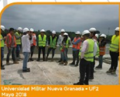
Universidad Militar Nueva Granada - UF2 Mayo 2018

Entre las universidades se encuentran la Universidad de la Sabana de Bogotá, Universidad Militar Nueva Granada, Universidad Pontificia Bolivariana de Montería, Servicio Nacional de Aprendizaje SENA Regional Atlántico y Universidad CUC de Barranquilla.