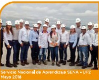
Servicio Nacional de Aprendizaje SENA - UF2 Mayo 2018