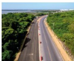
Doble calzada sector Las Flores

Este es el primer tramo de la Circunvalar de la Prosperidad, ya se encuentran culminados los 16.5 Km correspondientes a terraplén, subbase, base y carpeta asfáltica. Se adelanta la construcción de la intersección con la Via Oriental a la altura de PIMSA, donde ya se encuentran construidas las losas del tablero y se continúa trabajando en la instalación de carpeta asfáltica, instalación de New Jersey-defensas metálicas y urbanismo. Adicionalmente se avanza en los trabajos de construcción de la intersección Caracol, puente peatonal Galapa y el puente vehicular San Blas.