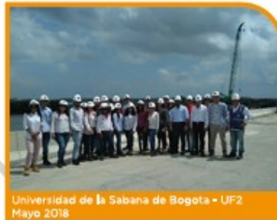
Universidad de la Sabana de Bogota - UF2 Mayo 2018

CONCESION COSTERA APORTA Y CONTRIBUYE CON EL APRENDIZAJE DE FUTUROS INGENIEROS