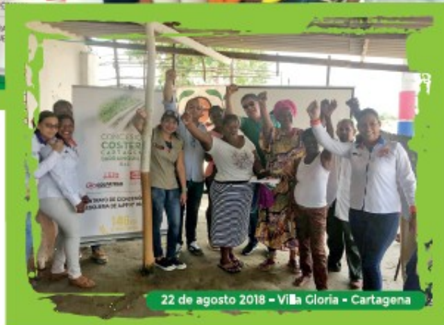
22 de agosto 2018 - Villa Gloria - Cartagena

La Concesión Costera y los Representantes de los Consejos Comunitarios trabajaron conjuntamente por el beneficio de la comunidad, cumpliendo 51 acuerdos de Puerto Rey y 52 de Villa Gloria, entre los que se destacan capacitaciones y certificaciones en cursos de construcción, fortalecimiento a la Asociación de Pescadores de Puerto Rey con entrega de lanchas, motores y remos, además de materiales y mano de obra para la construcción de un cerramiento para la cancha, fortalecimiento a la Asociación de Artesanas y Pescadores de Villa Gloria, con entrega de materiales, motores y canoas, así como la adecuación del comedor infantil y el CDI.