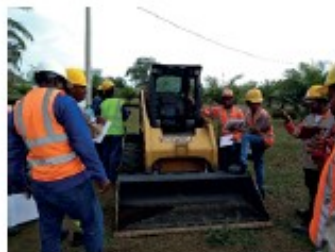
Curso de mantenimiento de Maquinaria Pesada