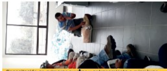
Capacitación en primeros auxilios y entrenamiento a miembros de la Brigada de Emergencia

Las actividades se desarrollan a través de escenarios que fortalezcan el conocimiento y estimulen las prácticas seguras para la atención de dichas emergencias.