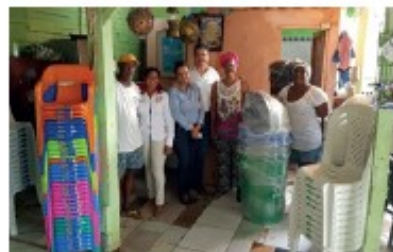
Adecuación de un comedor infantil y dotación de un Centro de Desarrollo Infantil