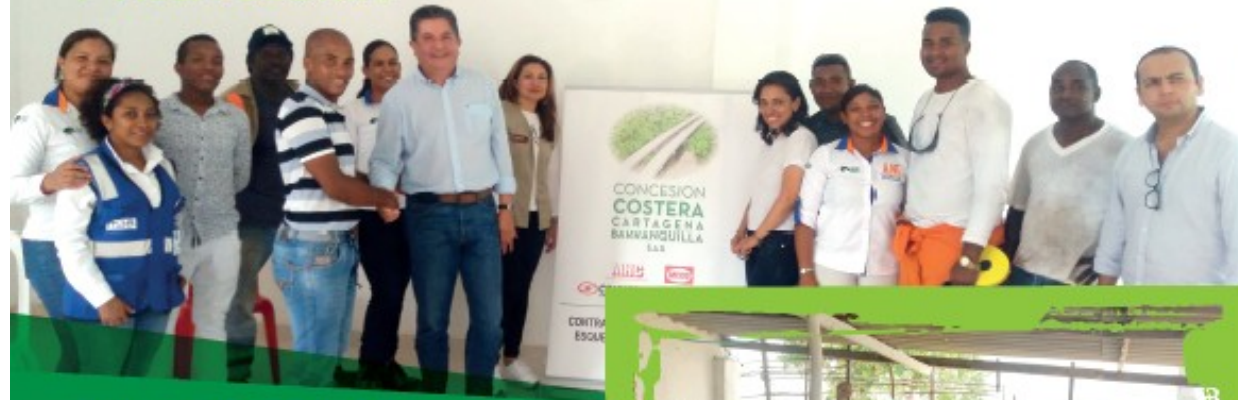
23 de agosto 2018 - Puerto Rey - Cartagena

El pasado 22 y 23 de agosto del 2018 se realizaron las reuniones de cierre de Consulta Previa con las comunidades de Puerto Rey y Villa Gloria, aledañas al Proyecto en Cartagena. El Concesionario cumplió con los acuerdos protocolizados en ambas comunidades contribuyendo así a su desarrollo social.