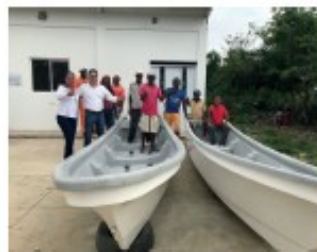
Entrega de lanchas para el fortalecimiento de las Asociaciones de pescadores