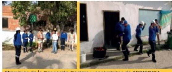
Miembros de la Concesión Costera y contratistas de SISMEDICA durante simulacro en control de incendios.